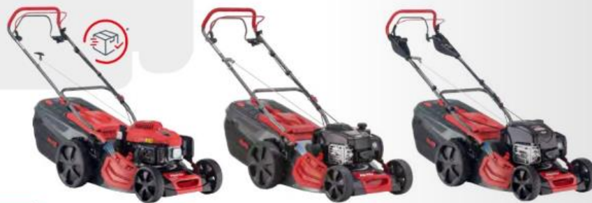
Premium 470 SP-A

QR-CODE SCANNEN UND DIE DATENBLÄTTER HERUNTERLADEN